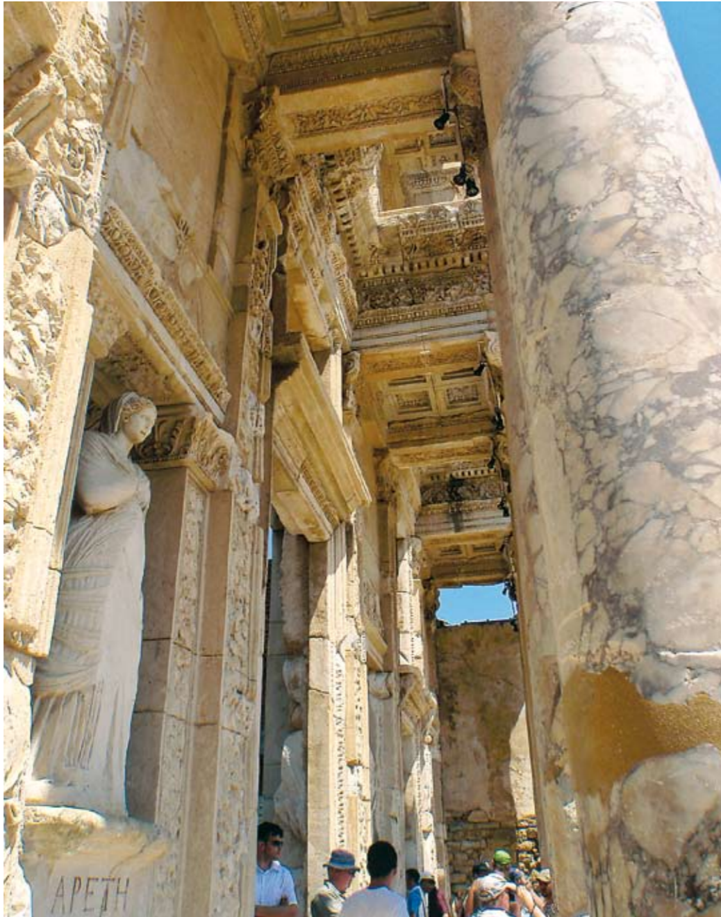
>Período helenístico. El sincretismo religioso fue una de las características centrales de la civilización que se desarrolló en Éfeso.

La avenida principal tenía mercados a lo largo de la calle, iluminada con lámparas de aceite todas las noches. El camino de piso de mármol te lleva por los antiguos lugares del mercado, los barrios donde vivían los ricos hasta el gran coliseo construido por el emperador Claudio. Tenían un alto estándar de vida: en la ciudad habían teatros, gimnasios, templos, baños comunales