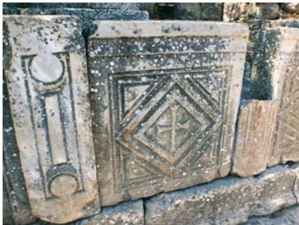
>Símbolos cristianos. Esta cruz tallada en piedra da fe de la obra de San Pablo y San Juan, que llegaron a predicar en Éfeso.