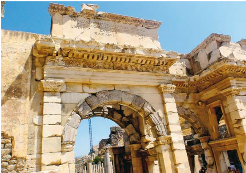
>Ópera magna. Impresionante arco construido en agradecimiento al emperador Augusto, por dos esclavos liberados por él.

A pocos minutos, en las colinas, se encuentra la casa de la Virgen María. San Juan fue a evangelizar a Éfeso acompañado de María, madre de Jesús. Se supo que los cristianos locales veneraban una pequeña casa en la colina atribuyendo su origen a María. En 1967, el Papa Pablo VI visitó el lugar donde ahora se encuentra una capilla, confirmando su autenticidad. Desde ahí, varios Papas han celebrado misas en la colina y hoy es un lugar de veneración. Juan Pablo II lo declaró