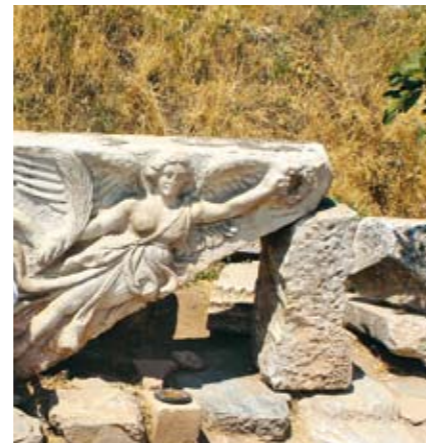
>Mármol vivo. La estatua de Niké, la diosa griega de la victoria, es uno de los mayores atractivos de Éfeso.