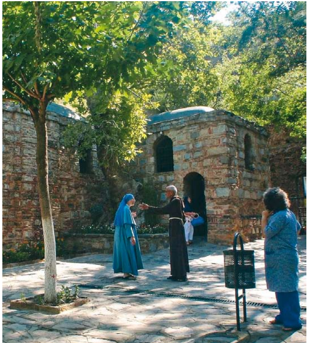
▶Santuario. La casa de María, donde vivió y murió la madre de Jesús.

Las letrinas eran los baños públicos de la ciudad, construidos en el primer siglo dC. Son más de 20 asientos de piedra uno junto al otro, contra la pared. Tenían un sistema de drenaje muy avanzado debajo de cada baño, y se