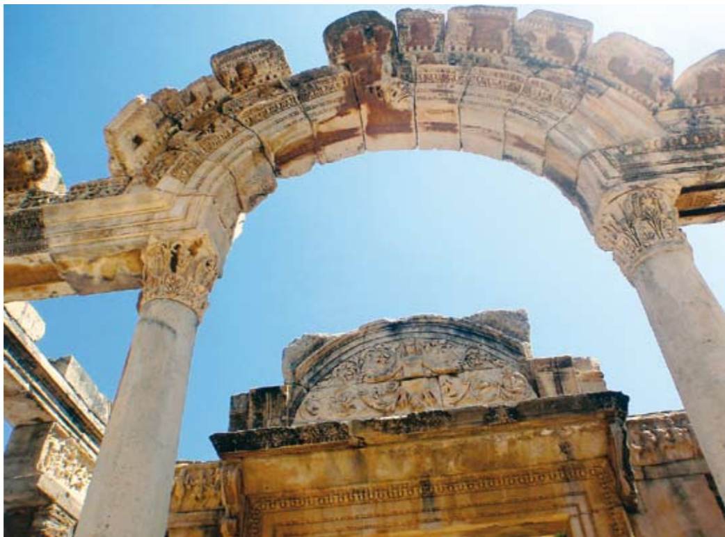
>Arquitectura eterna. Templo de Hadrian, dedicado al emperador Adriano, construido en 118 d.C. Sobresalen los arcos y columnas de estilo corintio.

LAS CONDICIONES DE VIDA EN ÉFESO -UN LUGAR AVANZADO PARA SU ÉPOCA, DEMOGRÁFICAMENTE DIVERSO Y DE CULTURA POLITEÍSTA- FUERON IDEALES PARA SEMBRAR LA RELIGIÓN CRISTIANA.